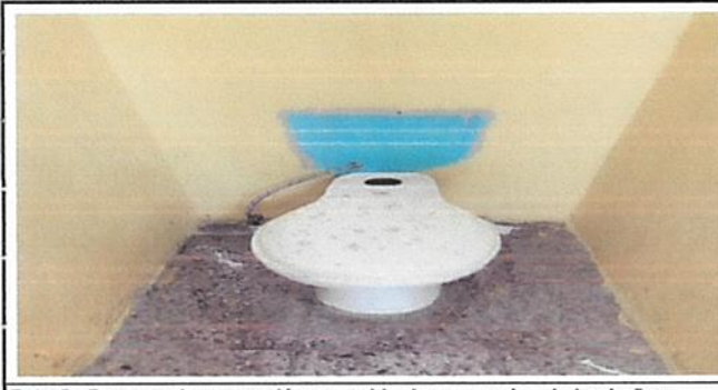
Foto 5: Proceso de reparación y cambio de accesorios de los baños.