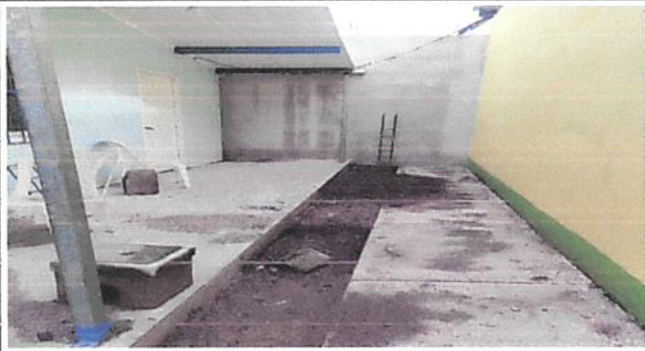
Foto1: Área de cocina no cuenta con drenaje para salida de pluvial.