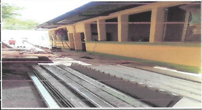
Foto7: Sustrucción de ventanas.